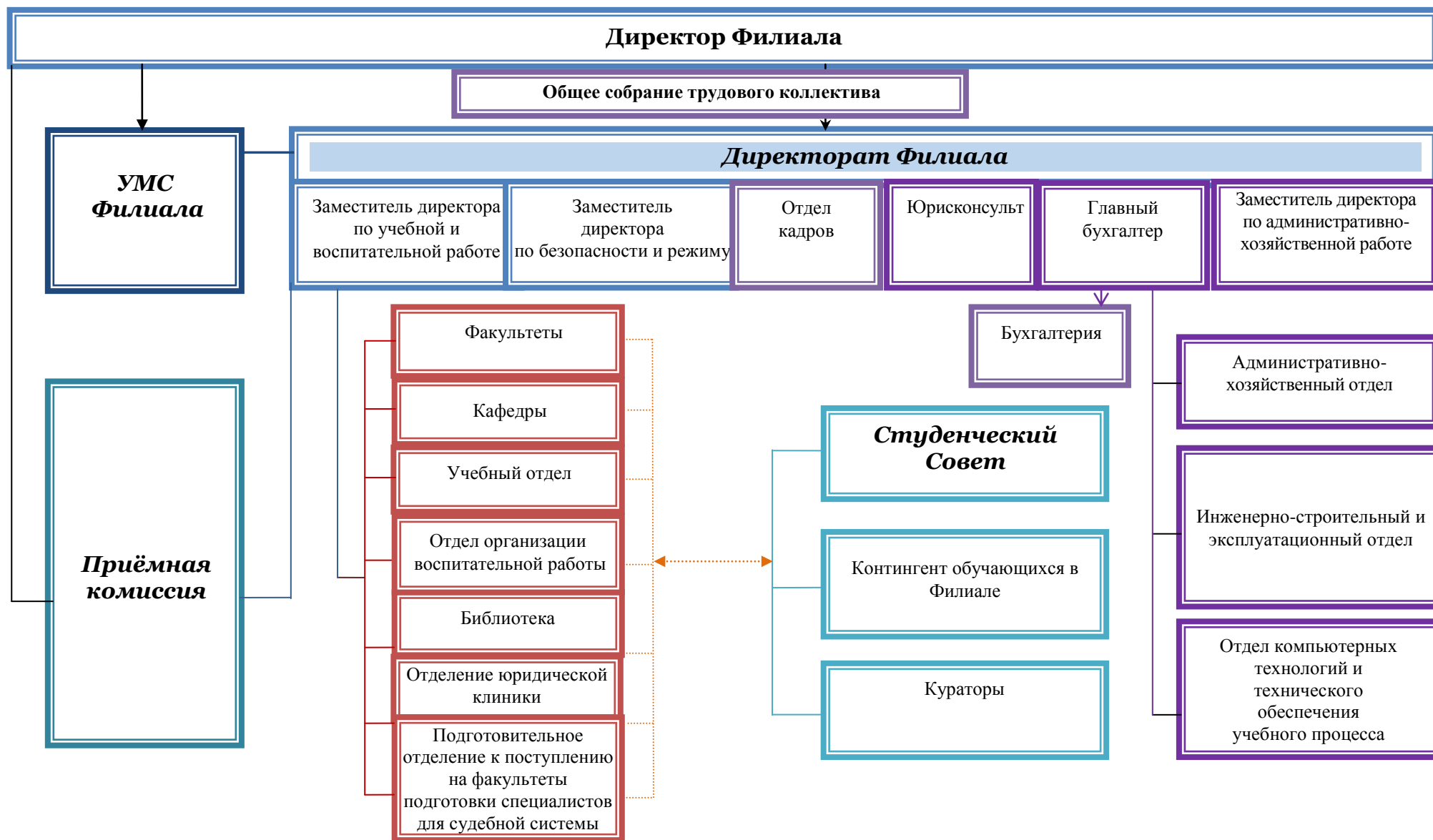
Рис. 1. Структура управления Филиала